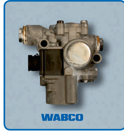
WABCO, 10 günlük tuz püskürtme testinde daha iyi performans göstermiştir.