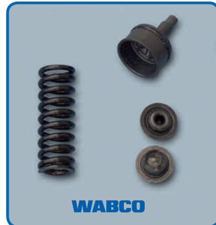
WABCO parçaları daha uzun ömürlüdür.

Bir arabayı almadan önce kaputun altına bakarsınız, o zaman sahte parçanın içinde neler var görebilirsiniz. Dıştan bakıldığında gerçeği kadar iyi görünebilir ancak içinde çabuk aşınan, kolay kırılan ve zorlu yol koşullarına dayanıklı olmayan kalitesiz parçalar olabilir.