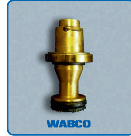
WABCO, kullanım ömrü performans testinde sahte parçadan kat kat daha iyi performans vermektedir.

Sahte parçalar daha ucuz olabilir, ama performansları düşüktür ve orijinal WABCO parçalarına göre daha kısa sürede aşınır. Bu da daha sık değiştirilmesi gerektiği anlamına gelir.