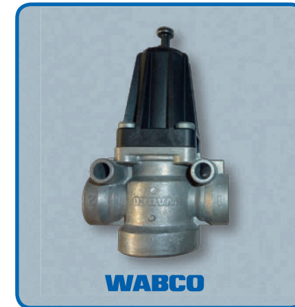
WABCO aşırı yük testinde de daha üstün.

WABCO basınç limitörü ve sahtesi, parçaların sağlamlığına yönelik aşırı yük testine tabi tutulmuştur. Sahte parça hemen kırılıp potansiyel bir fren performans kaybı ve arızası riski yaratırken WABCO parçası bütünlüğünü korumuştur.